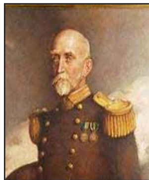
Gambar 2: Alfred Thayer Mahan

untuk memastikan kelangsungan kedaulatan wilayah, ekonomi, dan kesejahteraan negara. Melalui teorinya, Alfred Thayer Mahan (1913, 1987, 2010) telah mengusulkan 6 (enam) elemen penting yang perlu didukung oleh sesebuah negara untuk berkembang menjadi sebuah negara maritim, iaitu tiga elemen berkaitan kondisi alam; dan tiga elemen berkaitan penduduk, iaitu: (1) kedudukan geografi, atau geographical position ; (2) keadaan wilayah, atau physical conformation ; (3) perluasan wilayah, atau extent of territory ; (4) ciri-ciri masyarakat, atau character of the people ; (5) jumlah penduduk, atau number of population ; dan (6) ciri-ciri pemerintah, atau character of government (Mahan, 1913, 1987, 2010; Ali, Sulistiyono & Supriatna, 2021). Lihat gambar 2.