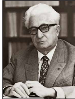
Gambar 1: Fernand Braudel

Dalam penelitiannya, Fernand Braudel (1992) mendapati bahawa selama berabad-abad lamanya, Laut Tengah telah berfungsi sebagai jambatan dan saluran yang telah mewujudkan pertukaran budaya, ekonomi, dan politik yang sangat beragam. Menurut Fernand Braudel (1992), sebelum pendekatan penulisan Annales , penelitian dan penulisan sejarah hanya bertumpu kepada courte durée (tempoh pendek), atau histoire événementielle (peristiwa bersejarah) sahaja, dan para sejarawan setakat memberi tumpuan kepada sejarah politik dan diplomatik ( histoire événementielle ), kurang mengambil berat kepada “sejarah struktural yang berjangka panjang” (Braudel, 1992; Ali, Sulistiyono & Supriatna, 2021). Lihat gambar 1.