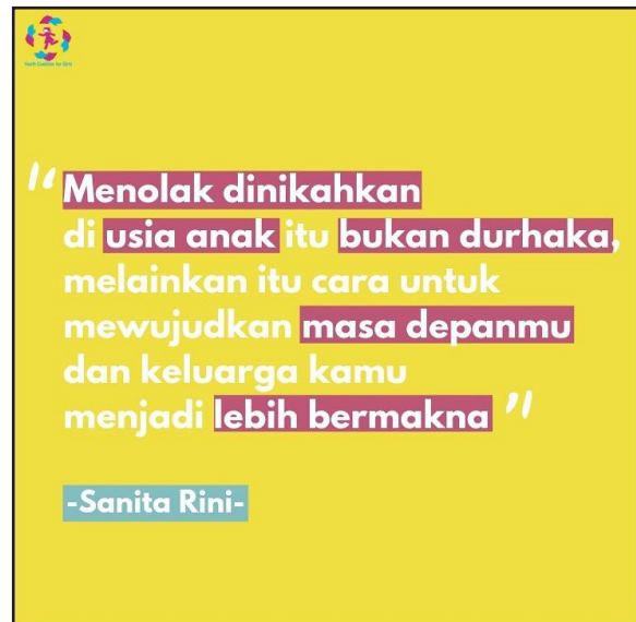
Gambar 3: Ekspresi Penolakan terhadap Pernikahan Dini oleh Generasi Millenial di Instagram (Sumber: Akun Instagram “Youth Coalition for Girls” dalam @ycg.id, 23/7/2019)

Kecenderungan Kajian Pendidikan IPS di Indonesia. Berdasarkan pengamatan terhadap terbitan dua jurnal nasional Pendidikan IPS (Ilmu Pengetahuan Sosial) yang sudah terakreditasi dengan standar nasional, kecenderungan pemerhati IPS adalah pada aspek pembelajaran yang terdiri dari metode, media, dan penilaian. Sedikit dari pemerhati yang berbicara tentang materi kajian IPS, pengembangan metode, serta metode dan media. Pengamatan ini diambil dari 16 artikel ilmiah yang diterbitkan dalam 2 jurnal terakreditasi secara nasional, yakni: pertama, Harmoni Sosial: Jurnal Pendidikan IPS , Volume 5, Nomor 1, Tahun 2018; serta, kedua, Jurnal Pendidikan Ilmu Sosial , Volume 27, Nomor 2, Tahun 2018; Jurnal Pendidikan Ilmu Sosial , Volume 28, Nomor 1, Tahun 2019; dan Jurnal Pendidikan Ilmu Sosial , Volume 29, Nomor 1, Tahun 2019.