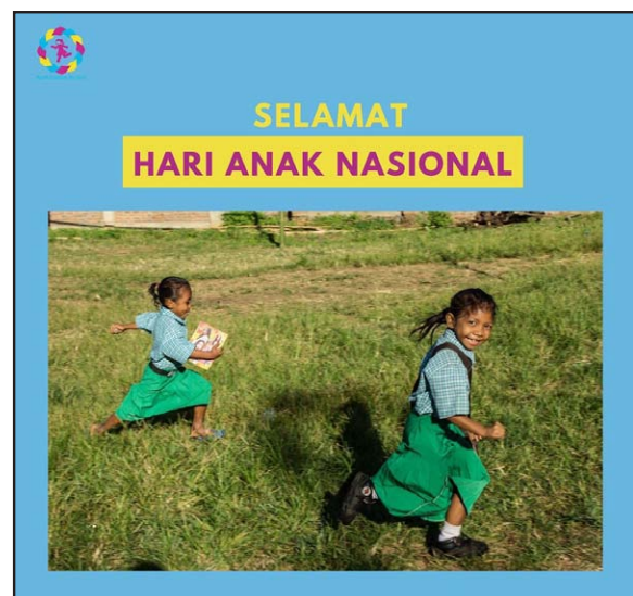
Gambar 2: Ekspresi Hari Anak Nasional oleh Generasi Millennial di Instagram