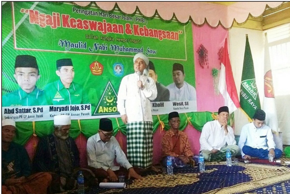
ASWAJA dan Umat Islam Indonesia

Pendidikan ASWAJA ( Ahlu al-Sunnah wal-Jama'ah ), baik di tingkat dasar maupun menengah, bertujuan untuk memperkenalkan dan menanamkan nilai-nilai faham ASWAJA secara keseluruhan kepada peserta didik, sehingga nantinya akan menjadi Muslim yang terus berkembang dalam hal keyakinan, ketakwaan kepada Allah SWT ( Subhanahu Wa-Ta'ala ), serta berakhlak mulia dalam kehidupan individu dan kolektif, sesuai dengan tuntunan ajaran Islam yang dicontohkan oleh para jama'ah , mulai dari sahabat Nabi, tabi'in , tabi'it , dan para ulama dari generasi ke generasi.