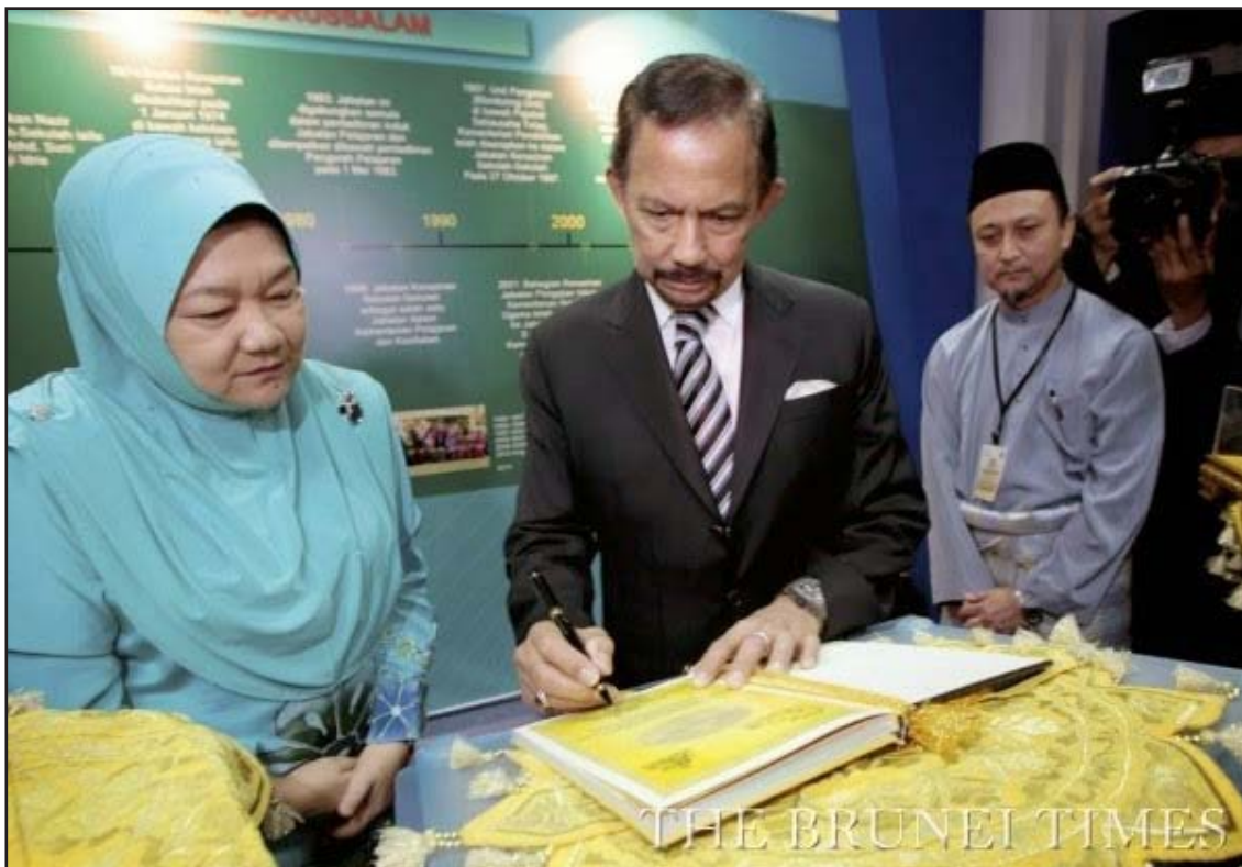
Dasar SPN21 di Brunei Darussalam

Dasar SPN21 (Sistem Pendidikan Negara Abad ke-21) mempunyai matlamat utama untuk merealisasikan visi Kementerian Pendidikan bagi mengwujudkan pendidikan berkualiti ke arah negara yang maju, aman, dan sejahtera, serta untuk merealisasikan misinya dalam memberikan pendidikan yang holistik bagi mencapai potensi yang penuh bagi semua. Bagaimanapun, dasar ini mendatangkan rasa tidak puas hati di kalangan masyarakat Islam di negara Brunei Darussalam, apabila mata pelajaran Agama Islam dan MIB (Melayu Islam Beraja) tidak menjadi mata pelajaran teras, sebaliknya hanya menjadi mata pelajaran pilihan.