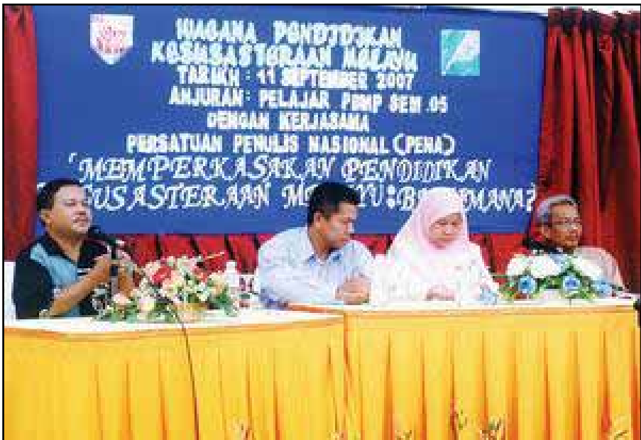
Gambar Guru Bahasa di Malaysia

Melalui mengajar, seorang guru mengekspresikan keperibadiannya. Apa yang ada pada susuk tubuh dan ditambah dengan seni lain yang ada seperti seni komunikasi, seni gerak, intonasi, berfikiran kreatif, dan inovatif, maka seorang guru itu mampu menarik perhatian pelajarannya.