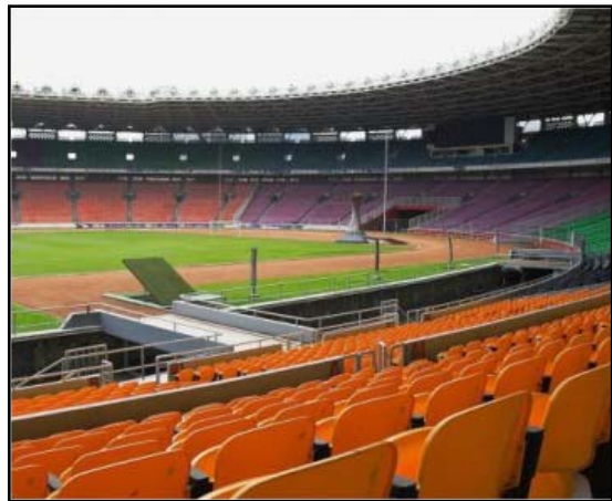
Pembangunan Olahraga di Indonesia

Melalui gerakan penyelenggaraan Asian Games tahun 1962 di Jakarta, bangsa Indonesia menggelorakan pembangunan tatanan kehidupan yang mandiri dan berbudaya, terhindar dari tekanan politik dunia internasional, dalam sebuah arena pertandingan olahraga yang penuh dengan semangat persamaan derajat sebagai sebuah bangsa yang berdaulat. Sisa sejarahnya adalah terbangunnya kawasan olahraga GELORA (Gelanggang Olahraga) Bung Karno di Senayan, Jakarta, yang kini telah banyak mengalami perubahan fungsi. Dengan demikian, visi pembangunan olahraga pada era Orde Lama adalah pembentukan karakter dan nasionalisme kebangsaan (ke-Indonesiaan) atau nation and character building .